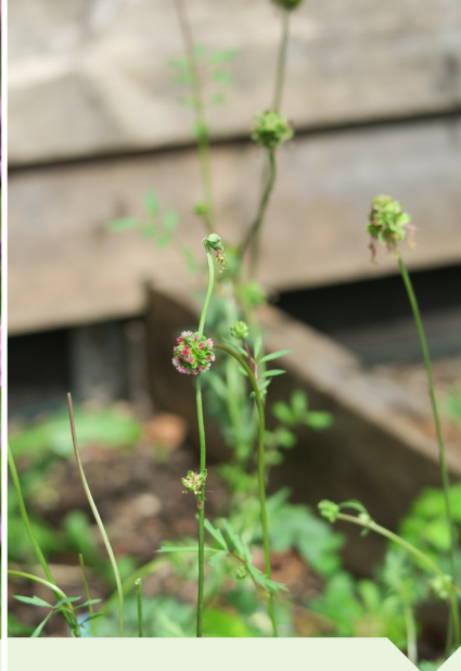
kleine pimpernel Sanguisorba minor