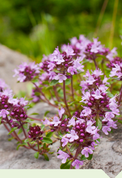
kruiptijm Thymus pulegioides