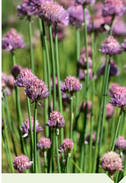
bieslook Allium schoenoprasum